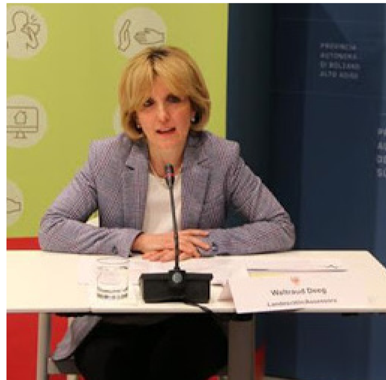
Seniorenlandesrätin Waltraud Deeg

weitere Vorschläge und Rückmeldungen zum Gesetzentwurf einbringen. Sobald der Erarbeitungsprozess abgeschlossen ist, wird über den Entwurf in der Landesregierung entschieden, bevor dieser an den Landtag weitergeleitet wird.